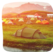
Διαμονή σε καταφύγιο