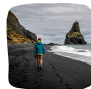
Black Sand Beach